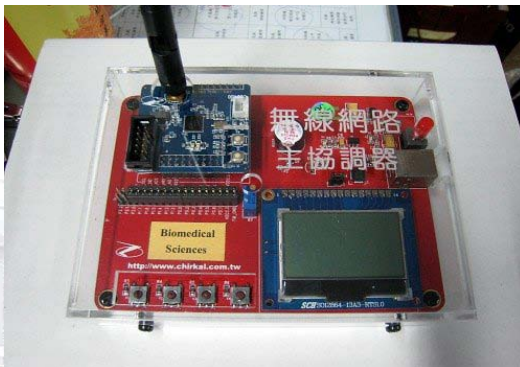
血氧脈搏感測模組