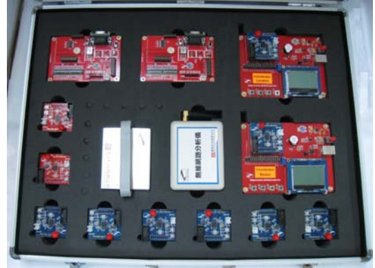
無線感測網路發展系統