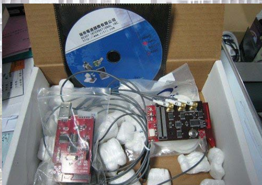
心跳/脈搏/體溫感測器